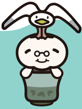
うけどんのばっば