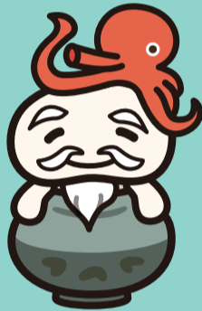
うけどんのじっち