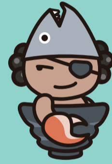
ブラックうけどん (友達)