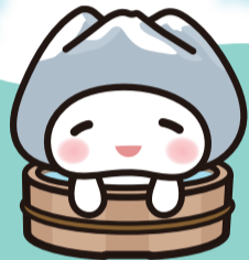
あだたらちゃん (いとこ)